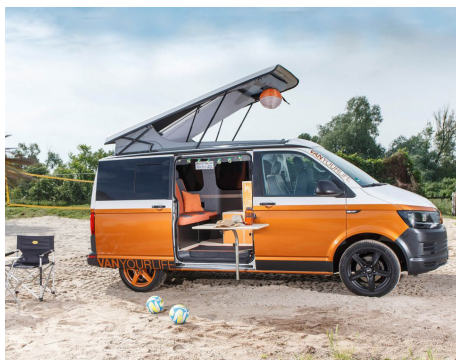
Spezialisiert auf den Ausbau von Camper-Bussen, möchte das Unternehmen seine Kundschaft über kurze, digitale Wege informieren und beraten

Die Einführung digitaler Maßnahmen sind ein wichtiger Baustein für den kurz- und langfristigen Unternehmenserfolg. Daher hatten wir bereits aus eigener Kraft einige Digitalisierungsprozesse angestoßen, auch im Online-Marketing und Social-Media (SoMe). Wir wollten strategische Maßnahmen aufbauen und umsetzen, um so die Kunden zielgerichtet erreichen und betreuen zu können.